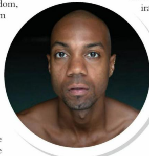
Predstava Crna rupa je postala priča o afričkom porektu našeg Plemena ( Tribe originalni naziv grupe)